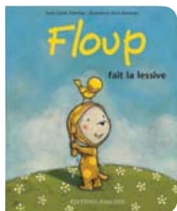
Floup fait la lessive 2 89608 030 9