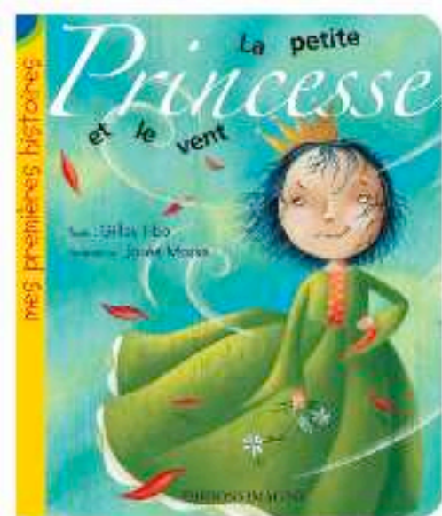
La petite Princesse et le vent ISBN 2-89608-034-1